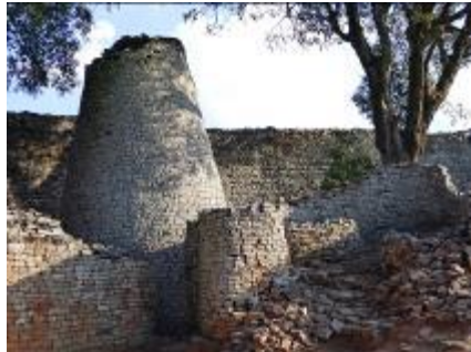
Great Zimbabwe - stolzes Zeugnis einer alten Kultur

März etwas 90% der Regenmenge liefert. Die restliche Zeit des Jahres herrscht ein feuchtheißes Klima mit gelegentlichen Regenfällen, die durch den Klimawandel aber stark abgenommen haben. Hitze und Dürreperioden machen die Versorgung mit Lebensmitteln für die Bevölkerung schwierig.