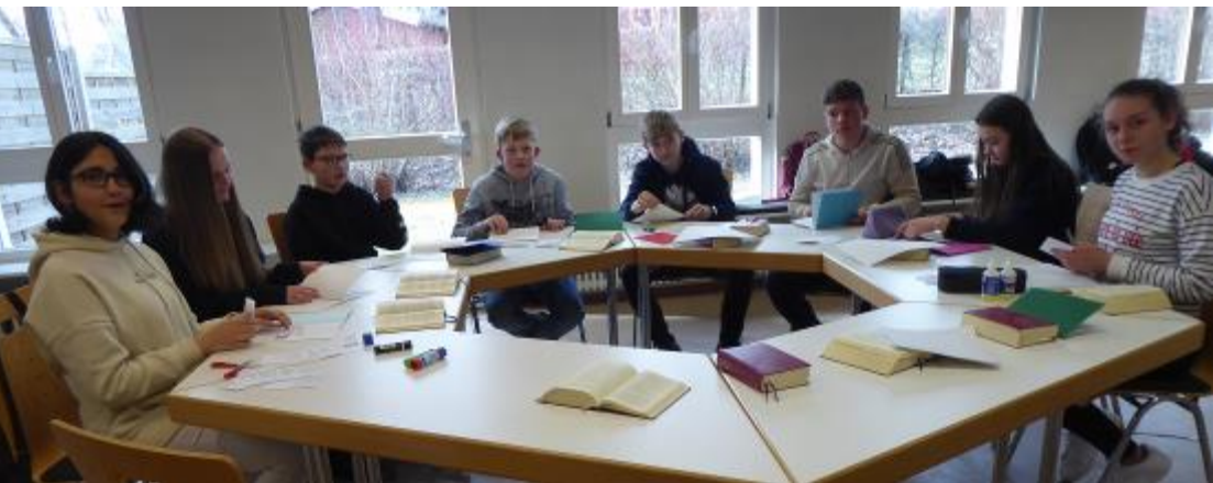
Arbeit an einem selbst zusammengestellten Gebetsbüchlein

Bis dahin sind auch wir gespannt, wie es weitergehen kann.