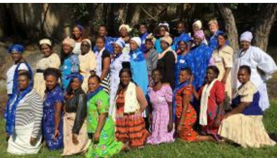
Das Vorbereitungscommittee 2020

Politisch gerieten die Menschen vom Regen in die Traufe. Zu Beginn der Selbstständigkeit wurde das Land noch von England verwaltet, aber nach der Wahl Mugabes zum Regierungschef geriet es mehr und mehr in Schwierigkeiten. Hatte Mugabe zu Anfang noch die Weißen enteignet und das Land den Kleinbauern zugeteilt, so stellte sich bald heraus, dass die Regierung sich nicht an Absprachen und Gesetze hielt und sich massiv selbst bereicherte. Mugabe verfolgte eine ähnliche Politik wie die Weißen vorher. Nur richtete sich nun der Hass auf Minderheiten wie Weiße, Obdachlose, Straßenkinder, Arme, Homosexuelle etc. Mehrmals erlebte das Land Zerstörungen von Elendsvierteln, Vertreibungen, ungesetzlichen Inhaftierungen und Massenmorde.