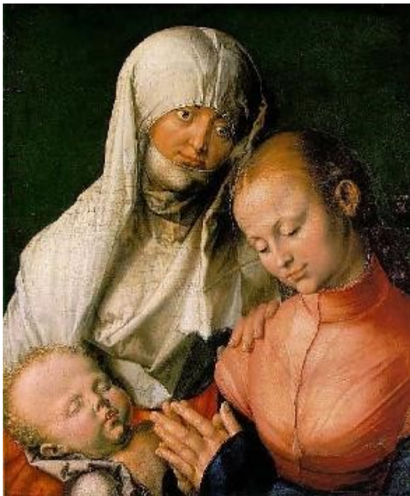
Albrecht Dürer: Annaseldritt 1519 Metropolitan Museum of Art New York "

kommt ein Engel und sagt ihnen, dass sie ein Kind bekommen werden.