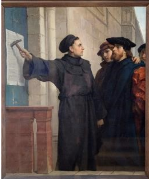
Foto: Das Gemälde von Ferdinand Pauwels, "Luthers Thesenanschlag", 1872 in der Luther

Die Römer benannten ihren achten Monat einfach nach seiner lateinischen Zahl, Octo. Nach der julianischen Kalenderreform 45 v. Chr. wurde der Name aber dem 10. Monat zugeordnet. Viele Versuche, den Monat Oktober umzubenennen, scheiterten kurz nach dem Ende der Regierungszeit des jeweiligen Regenten, der das Bestreben hatte, dies zu tun.