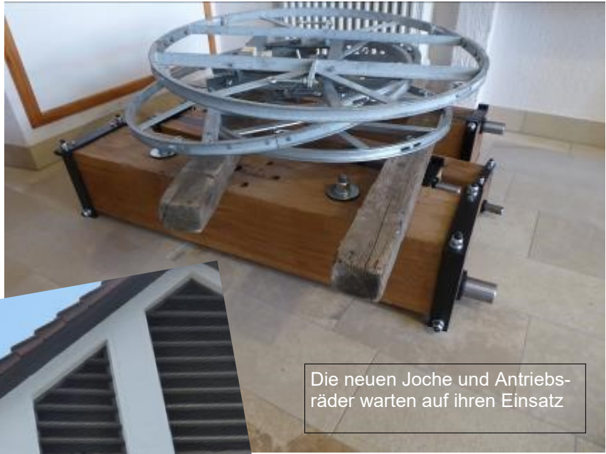
Die neuen Joche und Antriebsräder warten auf ihren Einsatz