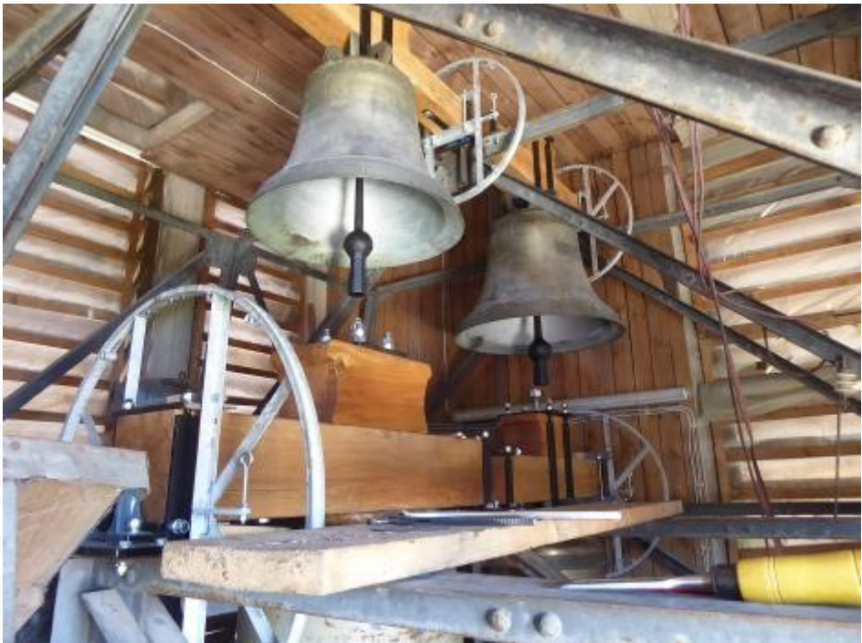
Fast fertig – es fehlen noch die Antriebsketten, die Verbindung zum Motor

Als die „Ersatzteile“ noch unten im Kirchturm lagen, fragten wir uns, wie sie wohl nach oben kommen würden - per Muskelkraft fast unmöglich, denn die Joche sind unheimlich schwer.