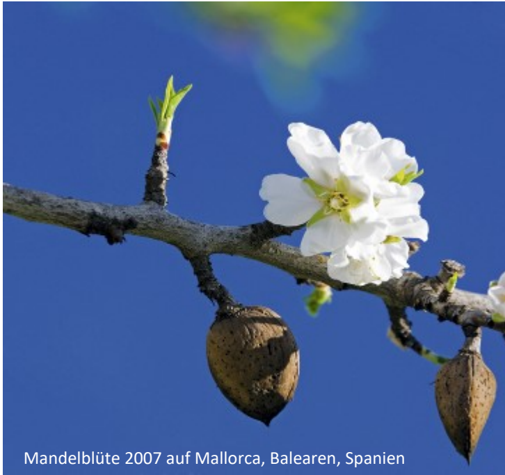
Mandelblüte 2007 auf Mallorca, Balearen, Spanien