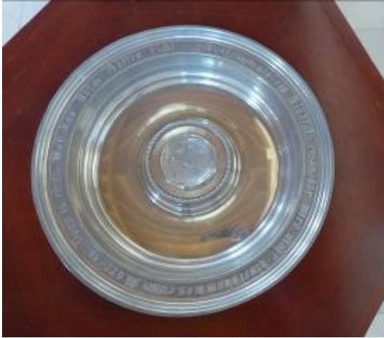
Bonndorfer Taufschale mit der Inschrift:

Wer das Reich Gottes nicht empfähet als ein Kindlein, der wird nicht hineinkommen.