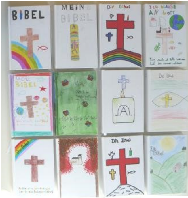
Bild: vom Konfirmandenjahrgang gestaltete Bibeleinbände

Am 14. Mai feiern wir dann die Konfirmation in Bonndorf.