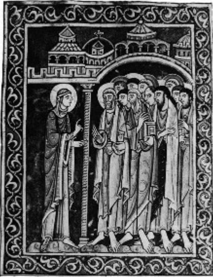
Maria von Magdala, auch Maria Magdalena genannt, die erste Osterzeugin, die den Jüngern die Botschaft der Auferstehung brachte, die „Apostelin der Apostel“

Frauen hatten bei Jesus auch immer einen besonderen Stand. Das apokryphe „Evangelium der Ma-