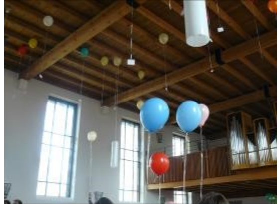
Luftballons trugen bei einem Jugendkreuzweg Wünsche zum Himmel

zusätzliche Einsatz, den die Beiden leisteten.