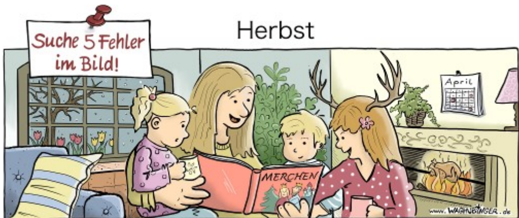
Tulpen, "Merchen", Geweih, April, Bratähnhähen