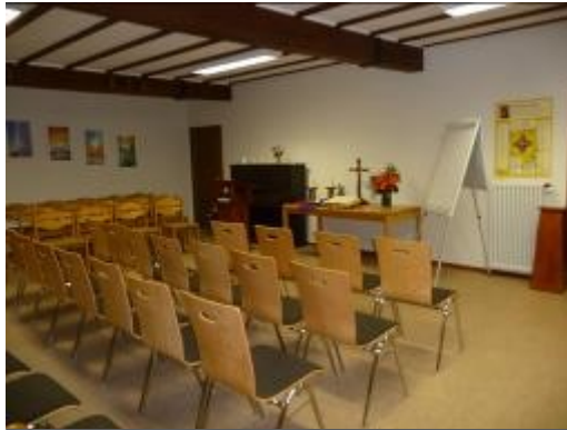
Während der Umbauphase fanden die Gottesdienste im Gemeindesaal statt— mit Klavier