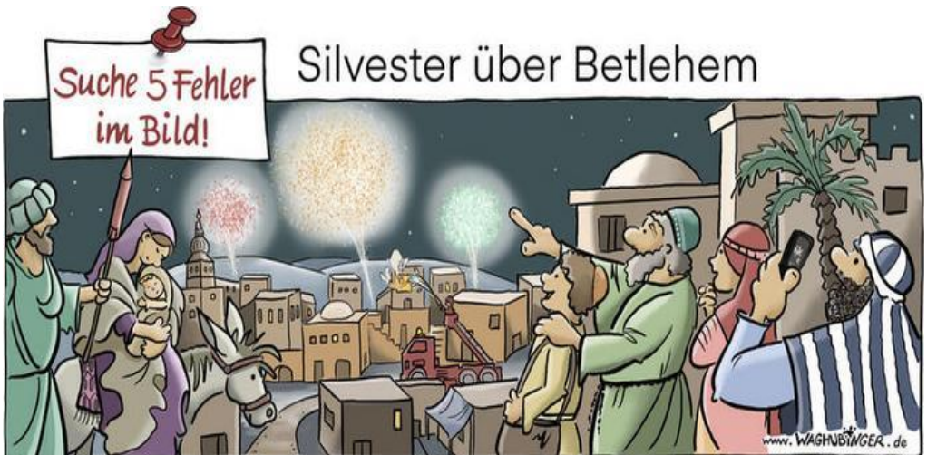
Rakete, Kirchturm, Feuerwerk, Feuerwerk, Handy, Handy