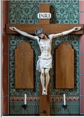
Gedenktafeln in der Kirche St. Peter und Paul Bonndorf

1. Weltkrieg: ca. 17 Millionen Kriegsopfer