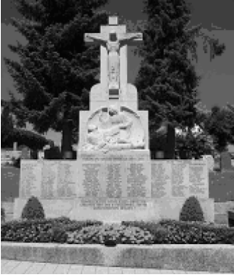
Gedenkstein beim Friedhof Grafenhausen